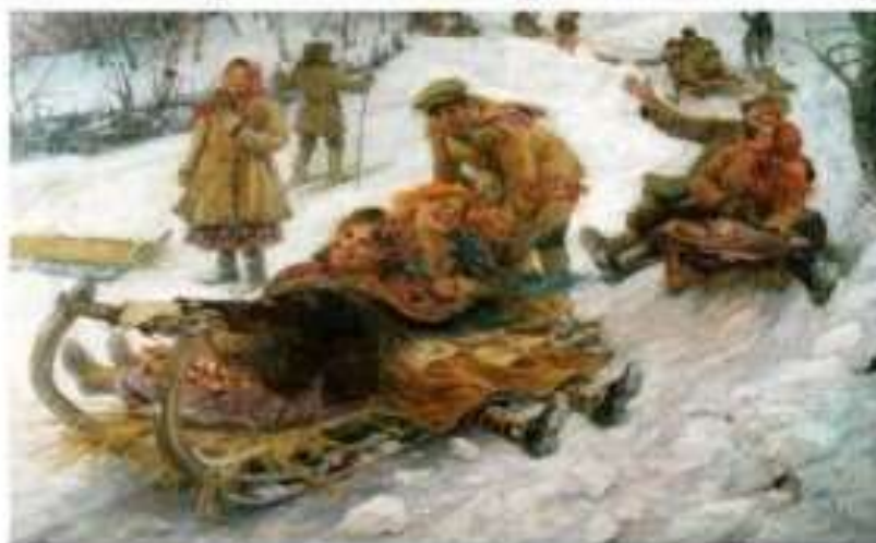
Ф.Сычков "Катание с гор"

Все ходили друг к другу в гости, пели песни. На заигрыш с утра приглашаются девицы и молодцы покататься на горах. Здесь можно было невесту найти, на суженого украдкой взглянуть. Но главное – как можно дальше прокатиться с горы, потому что катанье на масленицу не простое, а волшебное. Чем дальше прокатишься, тем длиннее вырастет лён в предстоящем году.