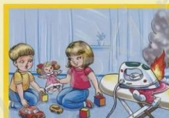
Не оставляй утюг без присмотра