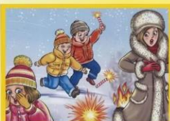
Петарды - опасны не играй с ними