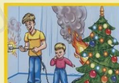
Не используй сломанные гирлянды