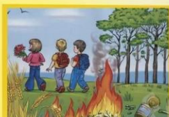
Охраняй лес не оставляй костёр