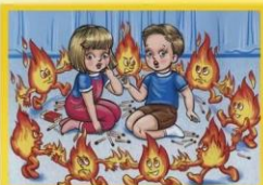
Спички детям не игрушка